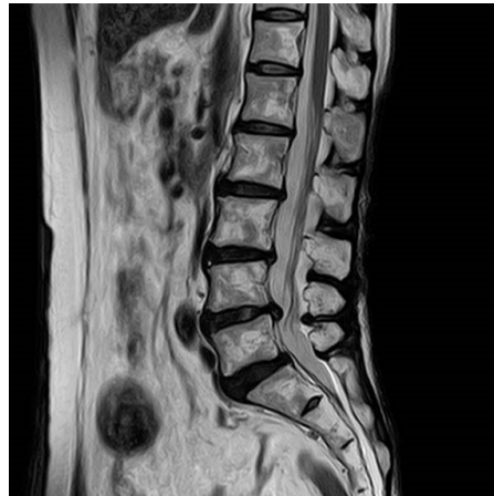
腰椎 SAG T2